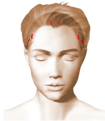
Incisions = cicatrices

Le jour de l'intervention, au moindre doute, un test nicotinique urinaire pourrait vous être demandé et en cas de positivité, l'intervention pourrait être annulée par le chirurgien.